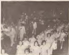
Grandioso parada di flambeuw y bandera mar- chando pa stadion ariba 18 di Maart 1977.